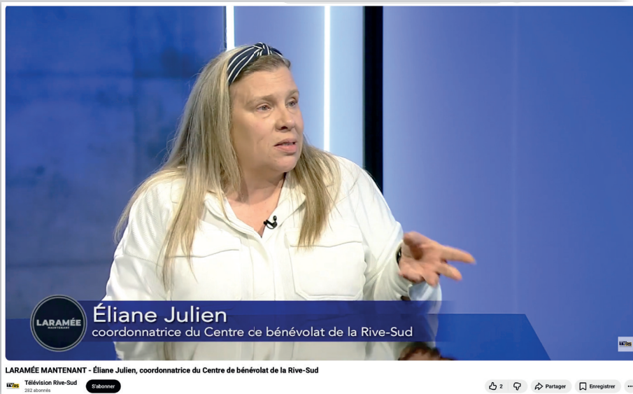
Entrevue à TVRS dans le cadre de la Semaine de l'action bénévole disponible sur notre site Internet et page Facebook