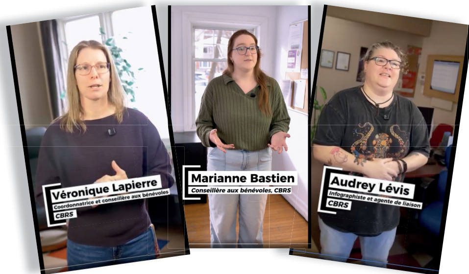
3 capsules web disponibles sur notre site Internet et page Facebook décrivant le CBRS, les multiples facettes du bénévolat et comment trouver un poste bénévole sur notre site.