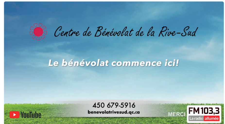
Publicité Radio103,3 fm