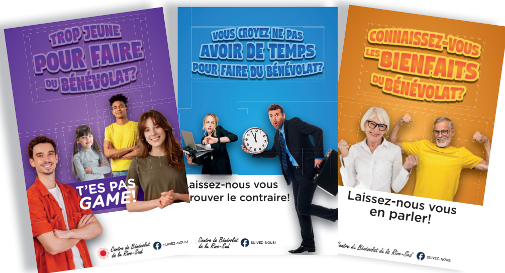
Distribution d'affiches de promotion multigénérationnelles

Le CBRS a mis sur pied un comité promotion afin de sensibiliser la population sur la force de l'implication bénévole et accroître les possibilités de promotion et de visibilité qui s'offrent à nous et aux organismes du milieu pour recruter plus de bénévoles. Nous continuons de faire des rencontres de promotion du bénévolat auprès des résidents de plusieurs RPA ainsi que de certains partenaires municipaux. Au cours de la dernière année, nous avons créé les outils promotionnels ci-dessous :